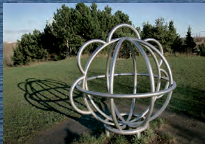
Bjerget med Planetstiens sol